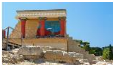
Εικόνα 9: Αρχαιολογικός Χώρος Κνωσού

Το έργο έχει προϋπολογισμό €274.493 συνολικά και χρηματοδοτείται από το Ευρωπαϊκό Ταμείο Περιφερειακής Ανάπτυξης, με επιβλέπουσα αρχή την Εφορεία Αρχαιοτήτων Ηρακλείου. Έχει ενταχθεί στο Επιχειρησιακό Πρόγραμμα «Κρήτη 2014-2020».