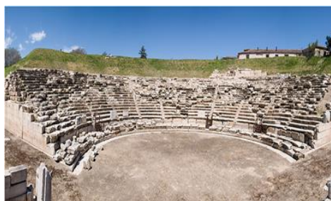
Εικόνα 10: Α' Αρχαίο Θέατρο Λάρισας

Το Α' Αρχαίο Θέατρο Λάρισας αποτελεί ένα από τα σημαντικότερα πολιτιστικά μνημεία στη χώρα που βρίσκεται εντός του πολεοδομικού ιστού της σύγχρονης πόλης της Λάρισας. Έχει συνολικό προϋπολογισμό €6.797.232 και υλοποιείται με την αυτεπιστασία της Εφορείας Αρχαιοτήτων Λάρισας, έχοντας ενταχθεί στο Επιχειρησιακό Πρόγραμμα «Θεσσαλία» 2014-2020, στον Άξονα Προτεραιότητας «Προστασία του Περιβάλλοντος - Μετάβαση σε μια οικονομία φιλική στο περιβάλλον». Βασικός σκοπός του έργου ήταν η περαιτέρω αποκατάσταση του μεγαλύτερου μέρους του κυρίως θεάτρου, καθώς οι παρεμβάσεις στόχευαν κυρίως στην άρση της επικινδυνότητας στην περιοχή των κάτω σειρών με την κατασκευή τοίχου αντιστήριξης. Ακόμα, προβλεπόταν η επανατοποθέτηση εδωλίων στην αρχική τους θέση στο χώρο του κυρίως θεάτρου και η τοποθέτηση νέων μαρμάρινων εδωλίων, διασφαλίζοντας την ασφαλή πρόσβαση των θεατών. Απώτερο στόχο της επέμβασης στο σκηνικό οικοδόμημα αποτελεί η στατική, μορφολογική και λειτουργική του αναβάθμιση.