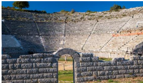
Εικόνα 11: Αρχαίο Θέατρο Δωδώνης

Το έργο έχει προϋπολογισμό €4.459.642 και εντάχθηκε στο Επιχειρησιακό Πρόγραμμα «Ηπειρος»2014-2020 με φορέα υλοποίησης την Εφορεία Αρχαιοτήτων Ιωαννίνων. Το αρχαίο θέατρο της Δωδώνης αποτελεί ένα αναπόσπαστο τμήμα της πολιτιστικής κληρονομιάς της Ηπείρου και η ανάγκη προστασίας, διατήρησης και προβολής τίθεται στο επίκεντρο της Περιφέρειας και της Πολιτείας.