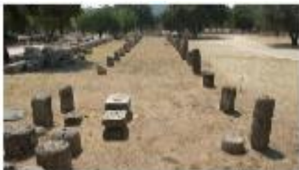
Εικόνα 8: Αρχαία Ολυμπία

Το έργο με προϋπολογισμό €603.573 υλοποιήθηκε με αυτεπιστασία από την Εφορεία Αρχαιοτήτων Ηλείας με χρηματοδότηση από το Επιχειρησιακό Πρόγραμμα «Δυτική Ελλάδα» 2014-2020 ). Απώτερος