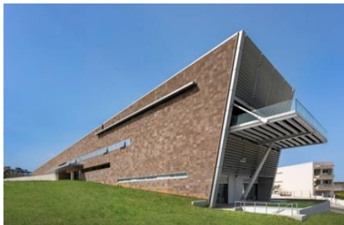
Εικόνα 12: Αρχαιολογικό Μουσείο Χανίων

Το έργο έχει προϋπολογισμό €3.220.217 με επιβλέπουσα αρχή την Εφορεία Αρχαιοτήτων Χανίων και εντάσσεται στο Επιχειρησιακό Πρόγραμμα «Κρήτη» 2014-2020 Ανώτερος σκοπός του έργου ήταν η λειτουργία μόνιμης έκθεσης των σημαντικών συλλογών του Αρχαιολογικού Μουσείου Χανίων (Α.Μ.Χ) στο νέο κτήριο στη Χαλέπα Χανίων τον Απρίλιο του 2021. Μέσω δύο διεθνών διαγωνισμών και ενός τακτικού, εξοπλήστηκαν οι αποθήκες με σύγχρονα συστήματα αποθήκευσης, πραγματοποιήθηκε η προμήθεια των νέων προθηκών, ώστε να είναι δυνατή η ασφαλέστερη και καλύτερη προβολή των εκθεμάτων, ενώ τέλος, έλαβε χώρα η αναπαράσταση των μνημείων και η μεταφορά των αρχαιοτήτων από το παλιό Μουσείο (Άγιος Φραγκίσκος) στο νέο κτήριο.