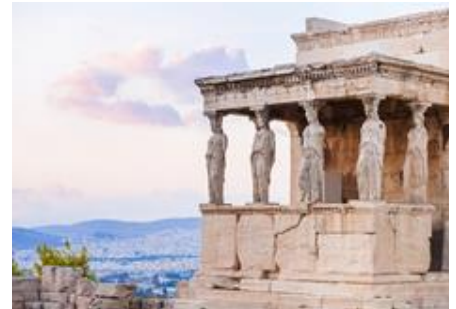
Εικόνα 1: Ερεχθείο Ακρόπολη

Για τους σκοπούς της εξέτασης των κοινωνικοοικονομικών επιπτώσεων των έργων πολιτισμού σε εθνικό επίπεδο και σε επίπεδο ΕΣΠΑ, συλλέχτηκαν στοιχεία για τους προϋπολογισμούς όλων των έργων σε επίπεδο Περιφέρειας. Η συνολική επένδυση ΕΣΠΑ σε έργα πολιτισμού για την χρονική περίοδο 2014-2020 αγγίζει τα €453 εκατ.