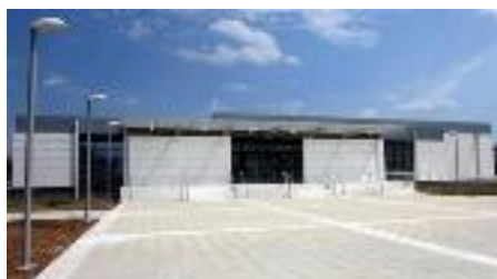
Εικόνα 14: Νέο Αρχαιολογικό Μουσείο Αλεξανδρούπολης

Το έργο είχε συνολικό προϋπολογισμό €2.911.659 εντάχθηκε στο Επιχειρησιακό Πρόγραμμα «Ανταγωνιστικότητα Επιχειρηματικότητα και Καινοτομία 2014-2020». Απώτερος σκοπός του ολοκληρωμένου και λειτουργικού Νέου Μουσείου Αλεξανδρούπολης είναι η συμβολή του στην προστασία και την ανάδειξη της πολιτιστικής κληρονομιάς, η δημιουργία νέων θέσεων εργασίας και τελικά η αύξηση της επισκεψιμότητας και η ενίσχυση της οικονομικής δραστηριότητας της περιοχής του Έβρου.