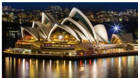
Εικόνα 2: Όπερα του Σίδνεϋ

Η Όπερα του Σίδνεϋ αποτελεί ένα από τα πιο χαρακτηριστικά και εμβληματικά τοπία της Αυστραλίας, φιλοξενώντας ετησίως χιλιάδες εκδηλώσεις πολιτιστικού και καλλιτεχνικού ενδιαφέροντος. Ως ένα από τα πιο γνωστά αξιοθέατα της χώρας προσελκύει στους χώρους της περίπου 10,9 εκ. επισκέπτες (2016-2017). Συγκαταλέγεται στα μνημεία Παγκόσμιας Πολιτιστικής Κληρονομιάς, συγκεντρώνοντας παγκόσμια αναγνώριση και θαυμασμό. Ενόψει της 40ης επετείου της το 2013, η Όπερα εγκαινίασε μια «Δεκαετία Ανανέωσης», σχεδιασμένη για να διασφαλιστεί ότι θα συνεχίσει να εμπνέει γενιές καλλιτεχνών, κοινού και επισκεπτών με ένα φιλόδοξο πρόγραμμα κεφαλαιουχικών έργων.