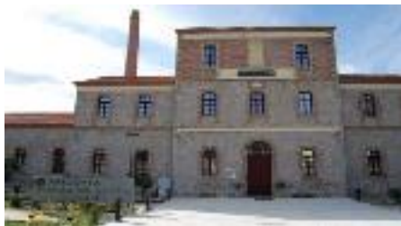
Εικόνα 15: Αρχαιολογικό Μουσείο Χαλκίδας- Αρέθουσα

Το έργο με προϋπολογισμό €1.199.515 εντάχθηκε στο Επιχειρησιακό Πρόγραμμα «Στερεά Ελλάδα» 2014-2020 με δικαιούχο την Εφορεία Αρχαιοτήτων Ευβοίας και χρηματοδοτήθηκε από το Ευρωπαϊκό Ταμείο Περιφερειακής Ανάπτυξης. Οι βασικές ενέργειες αφορούν στην υλοποίηση εγκεκριμένης Μουσειολογικής και Μουσειογραφικής μελέτης, για την Οργάνωση Μόνιμης Έκθεσης του Αρχαιολογικού Μουσείου.