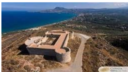
Εικόνα 16: Αρχαιολογικός Χώρος Απτέρα Χανίων

Το έργο «Ψηφιακές δράσεις προβολής του αρχαιολογικού χώρου της Απτέρας με χρήση τεχνολογιών αιχμής» εντάχθηκε στο Επιχειρησιακό Πρόγραμμα «Κρήτη» 2014-2020 με προϋπολογισμό €296.318.