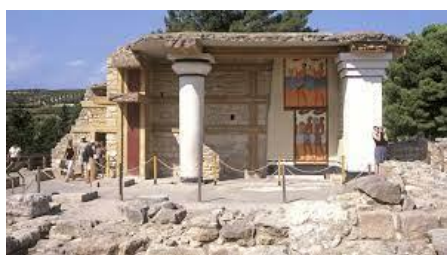
Εικόνα 17: Αρχαιολογικός Χώρος Κνωσού

Το έργο έχει συνολικό προϋπολογισμό €980.000, αναπτύσσεται στον οργανωμένο και επισκέψιμο αρχαιολογικό χώρο της Κνωσού και υλοποιήθηκε με αυτεπιστασία της Εφορείας Αρχαιοτήτων Ηρακλείου. Έχει ενταχθεί στο Επιχειρησιακό Πρόγραμμα «Κρήτη» 2014-2020. Σύμφωνα με εγκεκριμένες μελέτες, εκτελέστηκαν εργασίες συντήρησης και αποκατάστασης για τη διευθέτηση της απορροής των ομβρίων και τη στεγάνωση δώματος, την βελτίωση ή και την αποκατάσταση των ξύλινων διαδρόμων πορείας των επισκεπτών. Το Βορειοδυτικό άκρο του «Βασιλικού Δρόμου» και ο περιβάλλον χώρος της Βίλας Αριάδνη εξασφαλίζει λειτουργικές δυνατότητες και υποδομές εξυπηρέτησης επισκεπτών, συμπεριλαμβανομένων των ατόμων ΑμεΑ. Το έργο αναπτύσσεται στον οργανωμένο και επισκέψιμο αρχαιολογικό χώρο της Κνωσού