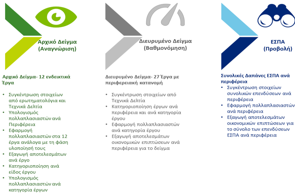
Σχήμα 3: Διαδικασία Επεξεργασίας Δεδομένων και Εξαγωγής Αποτελεσμάτων

Η μεθοδολογία υλοποίησης της επεξεργασίας των δεδομένων αλλά και μέτρησης των επιπτώσεων ανά διακριτή φάση αποτυπώνεται στο ακόλουθο σχήμα: