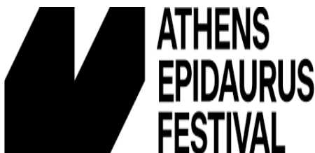
Εικόνα 18: Λογότυπο Φεστιβάλ Αθηνών- Επιδαύρου

Το έργο αφορά στην διοργάνωση καλλιτεχνικών παραγωγών στο πλαίσιο της Ελληνικού Φεστιβάλ Α.Ε. για τα έτη 2017, 2018, 2021 και 2022 και εντάσσεται στο Επιχειρησιακό Πρόγραμμα «Αττική» 2014-2020 με προϋπολογισμό €1.568.599. Στόχος της χρηματοδότησης ήταν η παραγωγή θεατρικών, μουσικών και χορευτικών παραστάσεων για κάθε προαναφερθέν έτος με παρεμβάσεις που αφορούν ενδεικτικά: