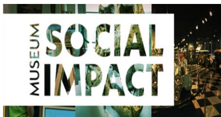
Εικόνα 5: Αμερικάνικη Ένωση Μουσείων (MOMSI)

Το εργαλείο “Measurement of Museum Social Impact” (εφεξής: MOMSI) αναπτύχθηκε από το Τμήμα Τεχνών και Μουσείων της Γιούτα (Utah Division of Arts and Museums) 5 το 2020-2021 στη βάση μιας μεθοδολογίας που προωθεί την πρακτική των μουσείων αναφορικά με τη μέτρηση του κοινωνικού τους αντικτύπου σε εθνικό επίπεδο. Ταυτόχρονα παρέχει τη δυνατότητα στα μουσεία να μπορούν να βελτιώνουν τις εσωτερικές διαδικασίες λειτουργίας τους, αξιοποιώντας αποτελεσματικά τυχόν χρηματοδοτικά εργαλεία που λαμβάνουν, ενισχύοντας παράλληλα τον θετικό τους αντίκτυπο στην κοινωνία. Η ομάδα εργασίας, συνεργάστηκε με 38 μουσεία συνολικά από διαφορετικές περιοχές της Αμερικής, για να λειτουργήσουν ως μουσεία υποδοχής για τη διεξαγωγή της έρευνας. Ο στόχος ήταν, κάθε μουσείο αντίστοιχα να συγκεντρώσει ένα δείγμα από 100 συμμετέχοντες συνολικά, με σκοπό τη συμμετοχή τους στην έρευνα. Στο πλαίσιο της έρευνας, οι συμμετέχοντες επισκέφθηκαν το κάθε μουσείο τουλάχιστον για τρεις (3) φορές, ενώ παράλληλα συμπλήρωσαν την έρευνα κοινωνικοοικονομικών επιπτώσεων. Για την μελέτη επιπτώσεων η ομάδα εργασίας του MOMSI αξιοποίησε τη μέθοδο της έρευνας “Retrospective Post-then-pre test”, η οποία πραγματοποιείται αφού οι συμμετέχοντες έχουν επισκεφθεί τα μουσεία, κατά τη διάρκεια διεξαγωγής της έρευνας.