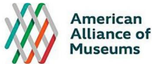
Εικόνα 6: Αμερικάνικη Ένωση Μουσείων

Το τμήμα Oxford Economics του Πανεπιστημίου της Οξφόρδης πραγματοποίησε εκ μέρους της Αμερικανικής Ένωσης Μουσείων (American Alliance of Museums) μελέτη για την μέτρηση των οικονομικών επιπτώσεων των Μουσείων της Αμερικής. Η ομάδα εργασίας αξιοποίησε τη μεθοδολογική ανάλυση του μοντέλου εισροών – εκροών για τη μελέτη του άμεσου, έμμεσου και ανά τομέα αποτυπώματος των μουσείων στην εθνική οικονομία. Η μελέτη φέρει τον τίτλο “Museums as Economic Engines – National Report”, και συνοπτικά καταγράφει το θετικό οικονομικό αποτύπωμα των μουσείων στην οικονομία των ΗΠΑ ως εξής: