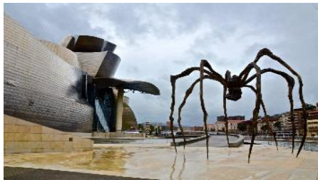
Εικόνα 4: Μουσείο Guggenheim, Μπιλμπάο

Το φαινόμενο Bilbao, γνωστό και ως “Bilbao effect”, είναι ένας όρος ευρέως διαδεδομένος που χρησιμοποιείται από οικονομολόγους για να περιγράψει τον οικονομικό και κοινωνικό αντίκτυπο του μουσείου Guggenheim στην Ισπανία. Το μουσείο χτίστηκε το 1997 και είναι ένα από τα πιο δημοφιλή μουσεία μοντέρνας τέχνης στον κόσμο. Πριν την ολοκλήρωσή του, το Μπιλμπάο ήταν μια πόλη με υψηλά επίπεδα ανεργίας και φτώχειας. Η κατασκευή του μουσείου οδήγησε σε σημαντική ανάπτυξη και βελτίωση της οικονομίας της πόλης του Μπιλμπάο.