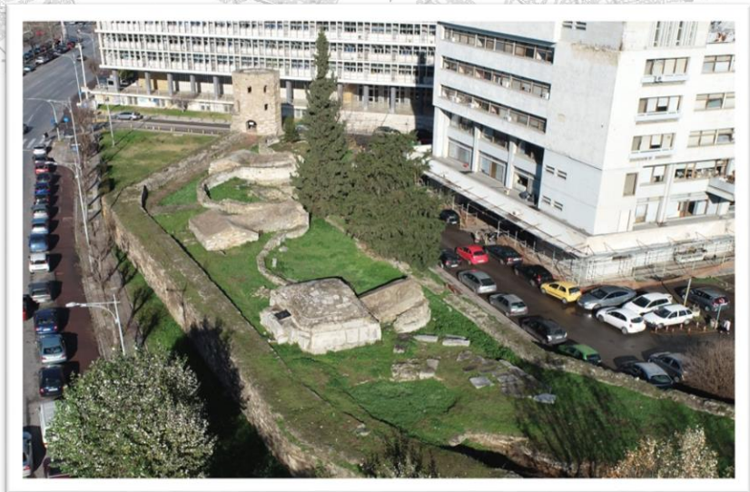
Εικόνα 1. Δυτικά Τείχη - Το φρούριο του Βαρδαρίου

Σήμερα, τα τείχη διασώζονται σε μήκος 4,5 χλμ., δηλαδή λίγο παραπάνω από το μισό της αρχικής τους περιμέτρου, που μετρούσε 8 χλμ., με κυρίαρχη την βυζαντινή κατασκευαστική τους φάση, όπως διαμορφώθηκε στα χρόνια της οθωμανικής κατάκτησης. Από την αρχική κατασκευή τους στους ελληνιστικούς χρόνους και μέχρι σήμερα, με όλες τις προσθήκες, μετατροπές και επισκευές που επιδέχθηκαν τα τείχη εξακολουθούν να κυριαρχούν στην εικόνα της σύγχρονης πόλης, οριοθετώντας τον ιστορικό πυρήνα της. Η κήρυξη των τειχών, στο σύνολό τους, ως ιστορικό διατηρητέο μνημείο έγινε με την υπ' αρ. 15813/19.12.1961 Απόφαση (ΦΕΚ 36/Β'/03-02-1962) και είναι χαρακτηρισμένα ως Μνημείο Παγκόσμιας Πολιτιστικής Κληρονομιάς από την UNESCO από το 1988.